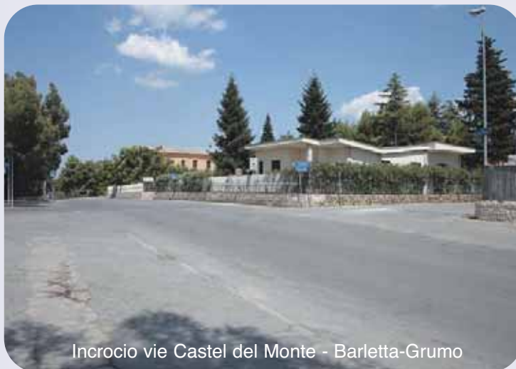
Incrocio vie Castel del Monte - Barletta-Grumo

automatici e semiautomatici nell'intero centro storico, per la chiusura al traffico e la conseguente pedonalizzazione; infine, presso tutti gli incroci semaforizzati saranno opportunamente sistemati attraversamenti pedonali colorati a base di resina, per garantire maggiore resistenza e visibilità.