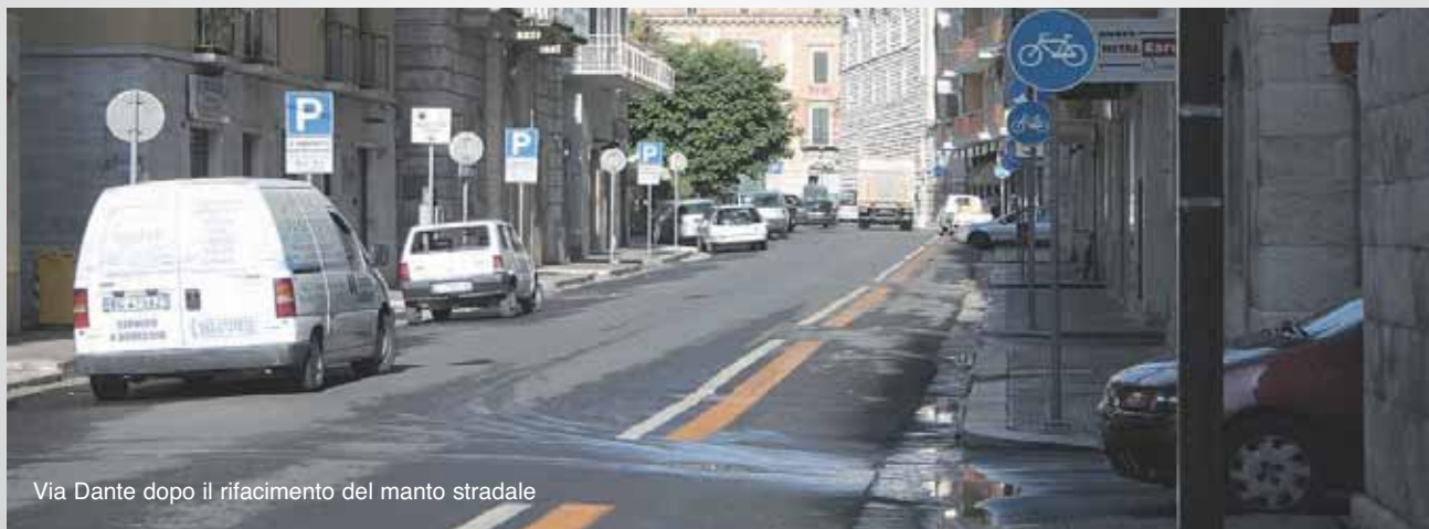
Via Dante dopo il rifacimento del manto stradale

Con altri due progetti sono stati sistemati i marciapiedi e le sedi stradali in due distinte zone dell'abitato, precisamente quella compresa fra le vie Ruvo, Montevideo, Luigi Tarantini, viale 4 Novembre e quella delimitata dalle vie Andria, Albertone, Mereù e Spirito Santo.